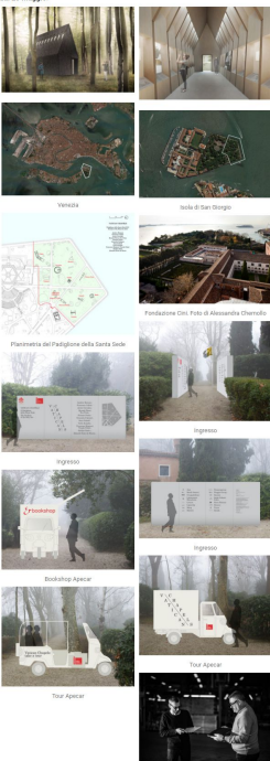
Vittorio Alpi mentre valuta le scandole con cui sono stati realizzati gli esterni del Padiglione Asplund.